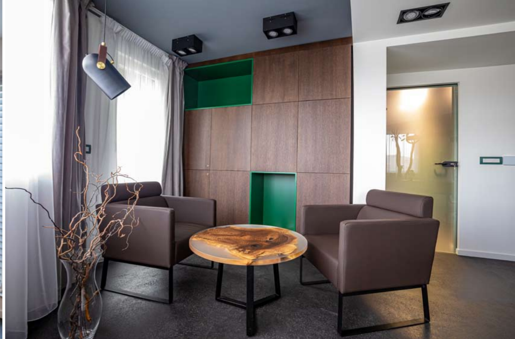
Усещането е за уютна обстановка, която се доближава много до домашната

кутия, а подредеността в офиса се осигурява освен чрез интериорните решения, също и чрез обособяването на складови и други помещения, в които са разположени сервизната техника и оборудването. Важен елемент за цялостната визия на работното пространство са декорациите с картини, чието авторство е на БондАрт.