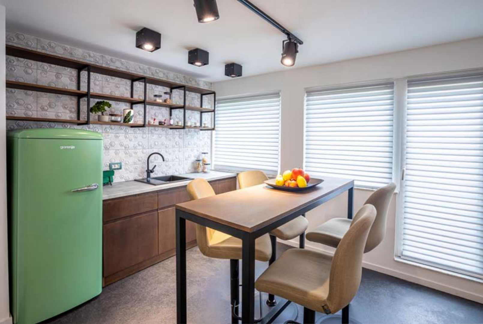
Кухнята е модерна и удобна

нението на мебелите и осветлението, които са проектирани и направени специално за този офис. Ергономичността е постигната чрез дизайна на работните столове, но и чрез възможността мониторите на компютрите да се движат по всички оси според нуждите на работещия. Практичността на всяко бюро се допълва от поп-ур